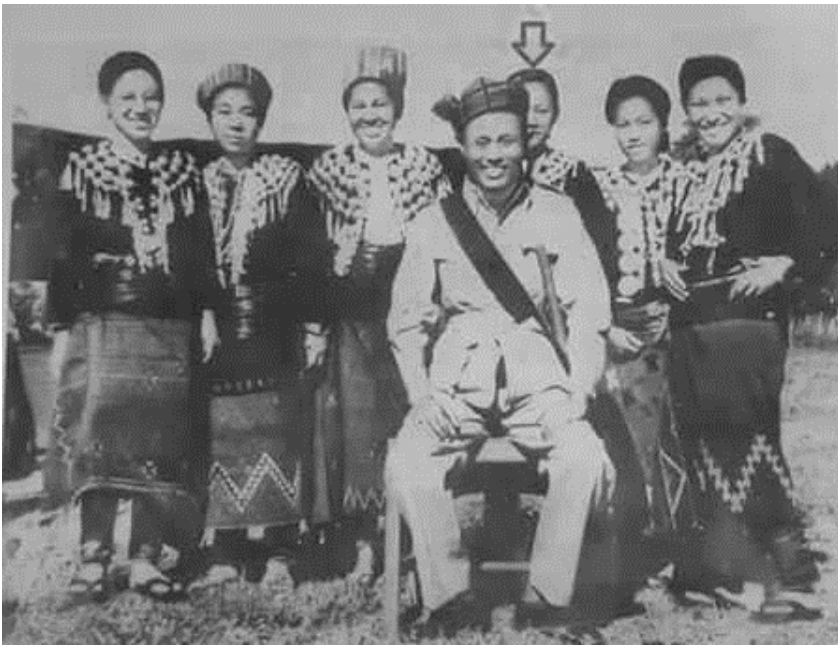
ကချင်ပြည်နယ်၊ မိန်ခိန်တွင် ၁၉၄၆ ခုနှစ်က ဗိုလ်ချုပ်အောင်ဆန်း၊ ဒူအင်ဖန်းဂျာရာနှင့် အခြားကချင်အမျိုးသမီးများ ဓာတ်ပုံတွဲရိုက်ထားပုံ။